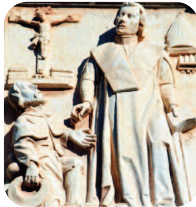
Santo Tomás de Villanueva. Alcalá de Henares (Madrid)

Ayúdame, Señor, a despojarme de mí, para entregarme todo a ti y, con las manos vacías de mí, permíteme verte en los ojos de tus pobres y en ellos servirte.