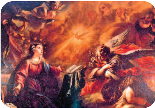
La Anunciación, Coello (s. XVII). Agustinas Recoletas, Monasterio del Santísimo Cristo de las Victorias, Serradilla (Cáceres).

La Anunciación a María representa mucho más que ese particular episodio evangélico, por otro lado fundamental: contiene todo el misterio de María, toda su historia, su ser, y al mismo tiempo habla de la Iglesia, de su esencia para siempre; como también de cada creyente en Cristo, de cada alma cristiana llamada. En este punto debemos tener presente que no